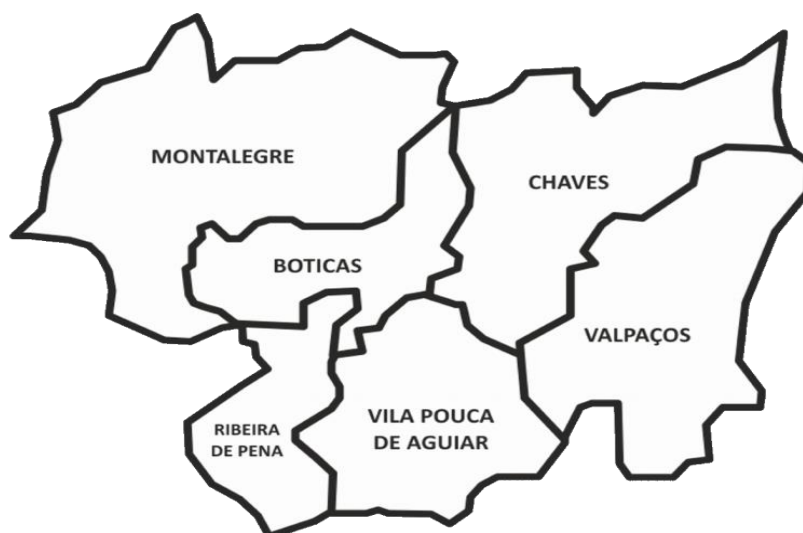
Figura 1 – Municípios do Alto Tâmega

A Região do Alto Tâmega (NUT III) situa-se no distrito de Vila Real, em Trás-os-Montes, faz fronteira a Norte com a região espanhola da Galiza, a Sul com a CIM do Douro, a Este, com a CIM de Terras de Trás-os-Montes e a Oeste, com as CIM's do Cávado e do Ave. Corresponde ao território abrangido pelos Municípios de Boticas, Chaves, Montalegre, Ribeira de Pena, Valpaços e Vila Pouca de Aguiar. No seu conjunto, a CIMAT tem uma área de 2.922 km 2 e na qual residem 94.143 habitantes (dados dos censos 2011).