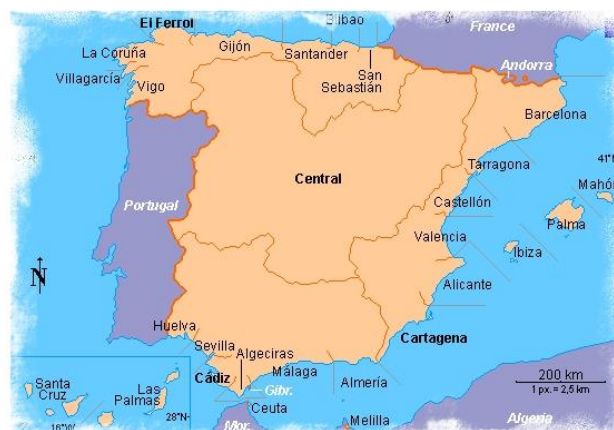
EXPORTAÇÕES POR CLASSE DE CARGA E PORTO DE EMBARQUE

O porto mais relevante na expedição de mercadorias para Espanha é Sines, que carrega 71,6% do total, seguindo-se Leixões, com 13,6% (em ambos são maioritários os 'produtos petrolíferos refinados') e Figueira da Foz, com 6,8% ('produtos não energéticos das indústrias extrativas; turfa; urânio e tório).